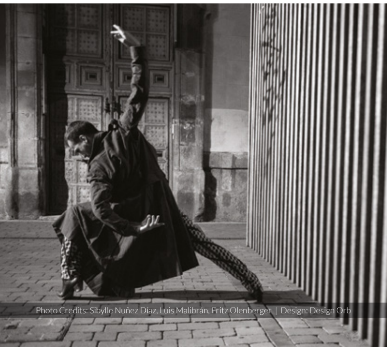
Design: Design Orb